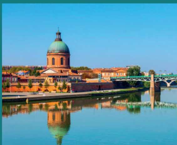
Hôpital de la Grave à Toulouse

À seulement 10 minutes à l'ouest de Toulouse et de son effervescence urbaine, Colomiers est une agréable commune de 39 000 habitants* prisée pour son calme et sa qualité de vie. Généreuse et ensoleillée, la ville se dote de beaux espaces verts et d'une grande richesse associative. Une vitalité locale également visible dans les infrastructures culturelles et sportives proposées aux habitants. Avec de nombreux commerces, un système éducatif complet et un réseau de transports en commun performant, la ville de Colomiers joue la carte de la proximité et de la mobilité. L'activité économique s'articule quant à elle autour de grands noms de l'aéronautique (Bréguet, Dassault, Airbus Group...) présents sur le territoire. Un vaste bassin d'emplois synonyme de belles opportunités professionnelles.