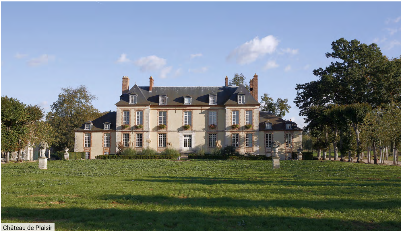
Château de Plaisir