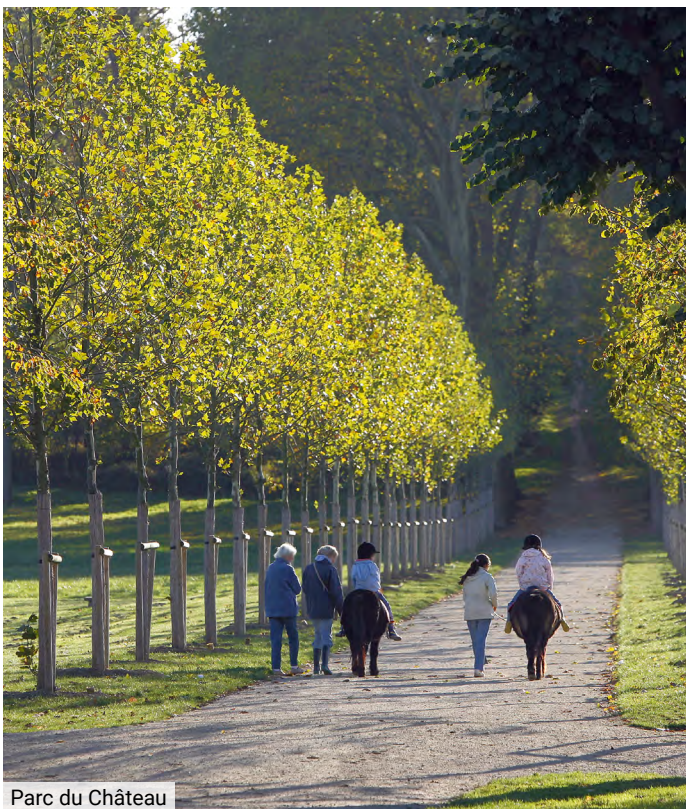
Parc du Château