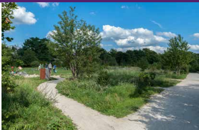
L'Éco-Parc des Carrières à 7 min* à pied de la résidence