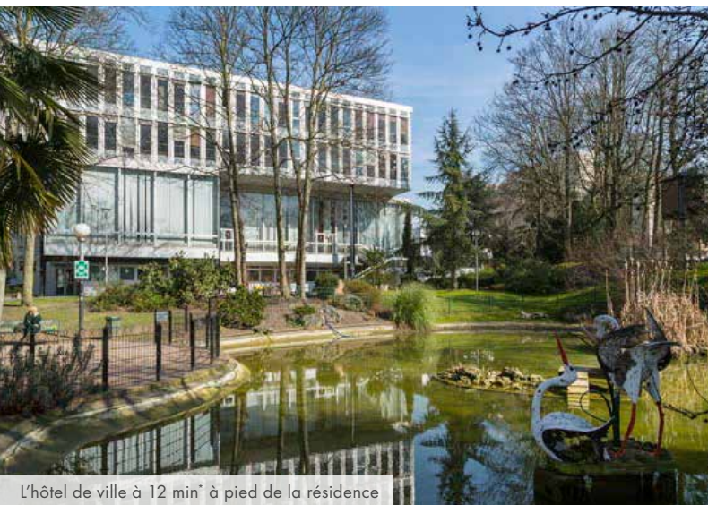
L'hôtel de ville à 12 min* à pied de la résidence

Aux portes de Paris, Fontenay-sous-Bois offre un environnement particulièrement agréable alliant douceur de vivre et dynamisme. Entre l'animation parisienne et la nature du Bois de Vincennes, les habitants profitent d'un cadre de vie idéal. Ses commerces, ses activités culturelles et sportives ainsi que son excellente desserte via les transports en commun en font une ville prisée tant par les familles que par les actifs.