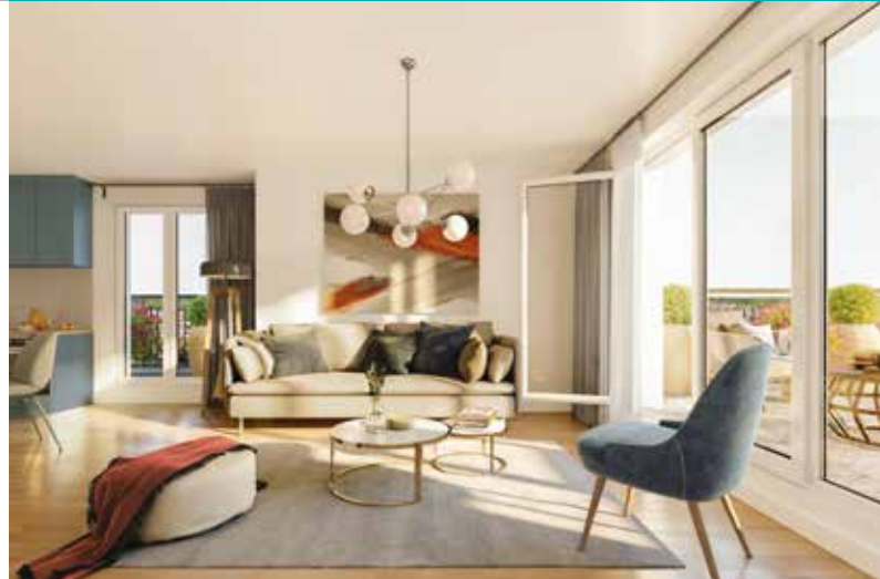
Illustration non contractuelle à caractère d'ambiance d'une résidence Cogedim