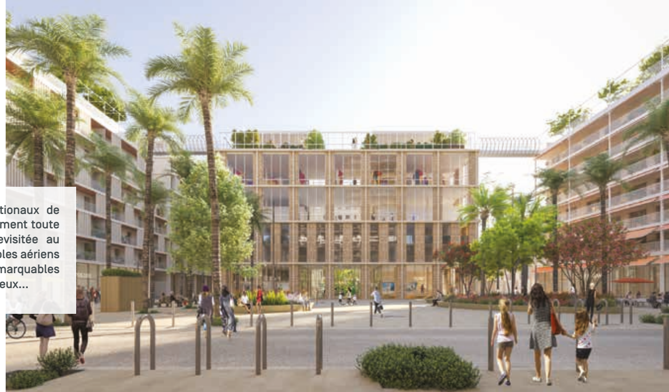
Vue depuis la Place Méridia

La conception des différents îlots résidentiels de JOIA a été confiée à plusieurs cabinets d'architecture de renommée internationale sélectionnés pour leur projection créative de l'habitat contemporain : Sou Fujimoto [Japon], Cino Zucchi [Italie], Laisné Roussel, Roland Carta, Lambert-Lenack, Chartier Dalix, Dimitri Roussel et Anouk Matecki [France] . Le cabinet paysagiste Alain Faragou a conçu le volet végétal et l'intégration de l'agriculture urbaine au cœur du projet. Sur le concept de « minéralité diaphane », chaque architecte a porté son propre regard esthétique sur la conception des immeubles. Mais tous ont développé une approche bioclimatique de l'architecture donnant la priorité à la lumière, à la générosité des espaces de vie et au confort intérieur. À JOIA, les appartements sont toujours lumineux, souvent traversants ou à double orientation.