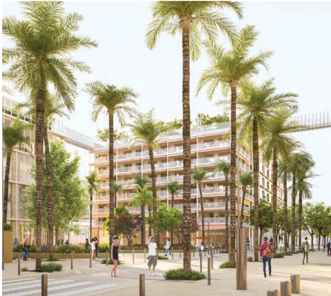
Vue depuis la Place Méridia