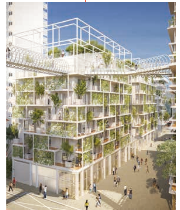
Bâtiment de bureaux, vue depuis la Place Méridia

JOIA améliore la notion même de travail avec ses espaces de bureaux innovants, connectés et modulables.