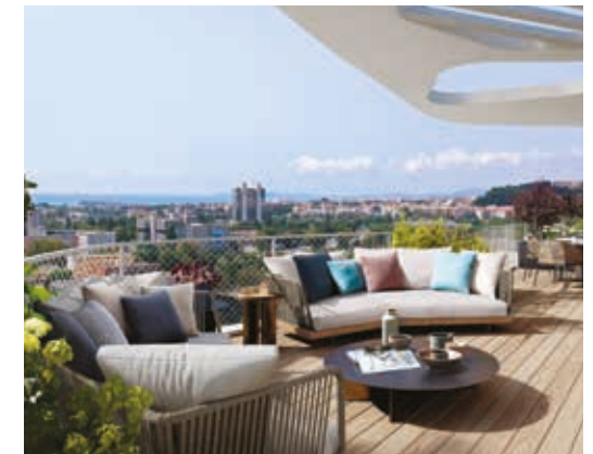
Résidence HANA, vue d'une terrasse

Ici, vous pouvez sélectionner le logement le mieux adapté à votre mode de vie, du studio au grand duplex 5 pièces. Quelle que soit la configuration choisie, vous bénéficiez des avantages d'une habitation neuve, de haute qualité architecturale et environnementale, dotée de belles prestations et d'un espace extérieur privatif.