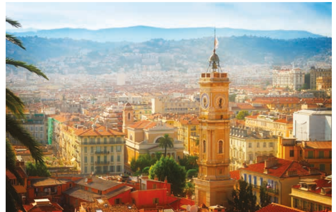
Tour Saint-François, vieille ville