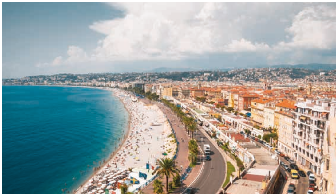
Promenade des Anglais

De la Ligurie antique au 21 e siècle, la cité azurée à l'épreuve du temps