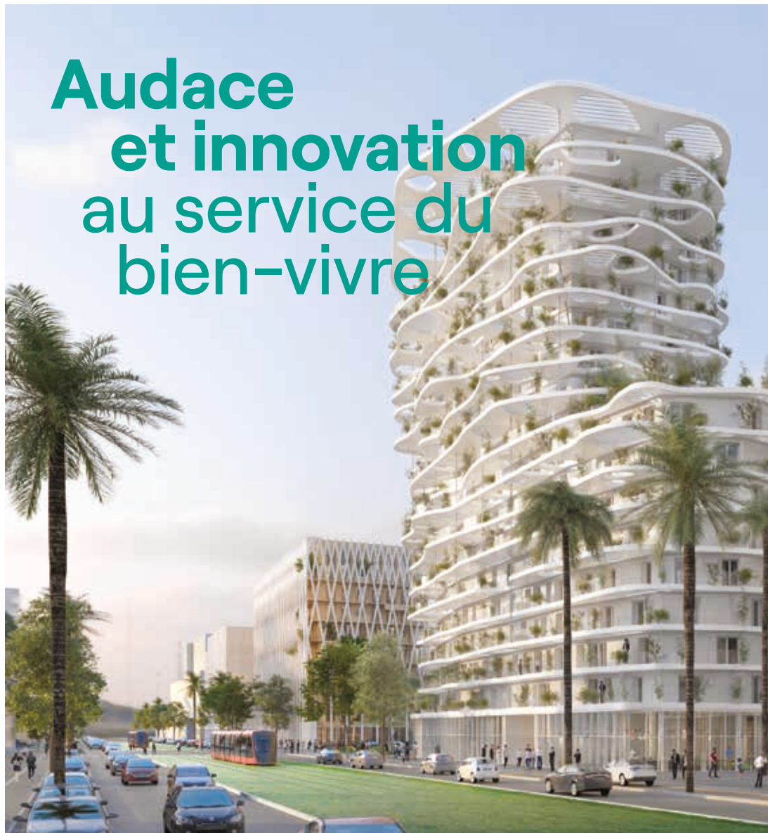
Résidence HANA, vue depuis la Place Métropolitaine

JOIA, ce sont plus de 780 habitations co-réalisées par Pitch Immo et Eiffage Immobilier. Dans ce lieu de vie novateur, véritable référence de l'habitat du 21e siècle, les opérateurs mettent en œuvre un cadre de vie éco-responsable.