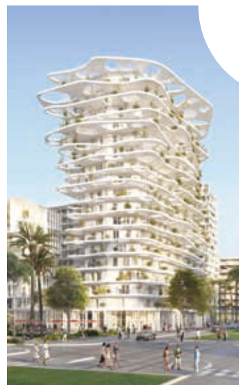
Résidence HANA, vue depuis la Place Métropolitaine

Les terrasses, balcons et loggias de JOIA ont été étudiés pour profiter au maximum de la lumière naturelle et de vues dégagées sur l'espace urbain et la plaine du Var jusqu'à la mer.