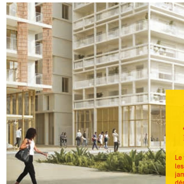
Vue depuis la place Méridia

Une nouvelle centralité de Nice, un nouveau lieu de vie éco-responsable, JOIA Méridia accueille des activités de hautes technologies et des équipements dédiés aux loisirs, aux sports et à la culture.