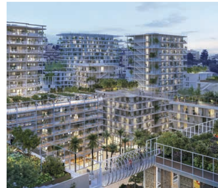
Vue générale de JOIA

Un rendez-vous au clair de lune, une escapade sur les toits ? Les passerelles illuminées par une oeuvre d'art qui desservent différents niveaux des immeubles convergent vers les jardins suspendus, les belvédères de JOIA ou les tables de la Merenda, des espaces partagés accessibles lors de manifestations culturelles ou pédagogiques où l'on dégustera les fruits et les légumes des jardins de JOIA.