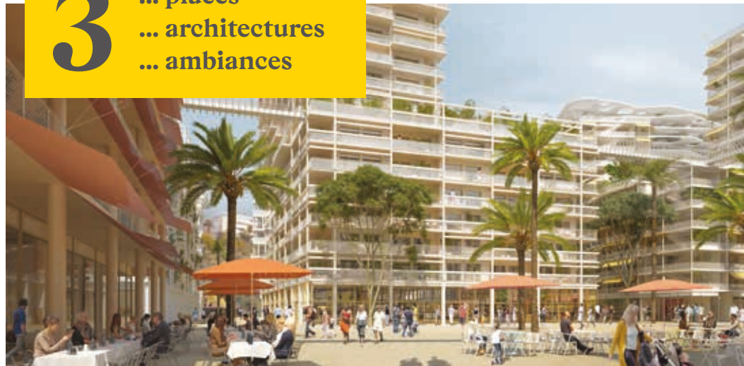
Vue depuis la Place Méridia

3 ... places ... architectures ... ambiances