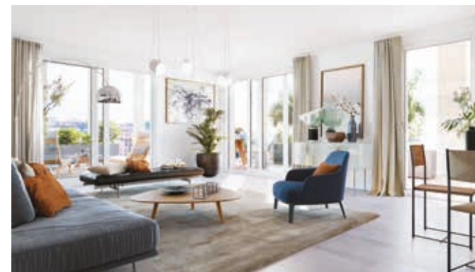
Résidence REVA, vue d'un salon

Les terrasses, balcons et loggias de JOIA ont été étudiés pour profiter au maximum de la lumière naturelle et de vues dégagées sur l'espace urbain et la plaine du Var jusqu'à la mer.