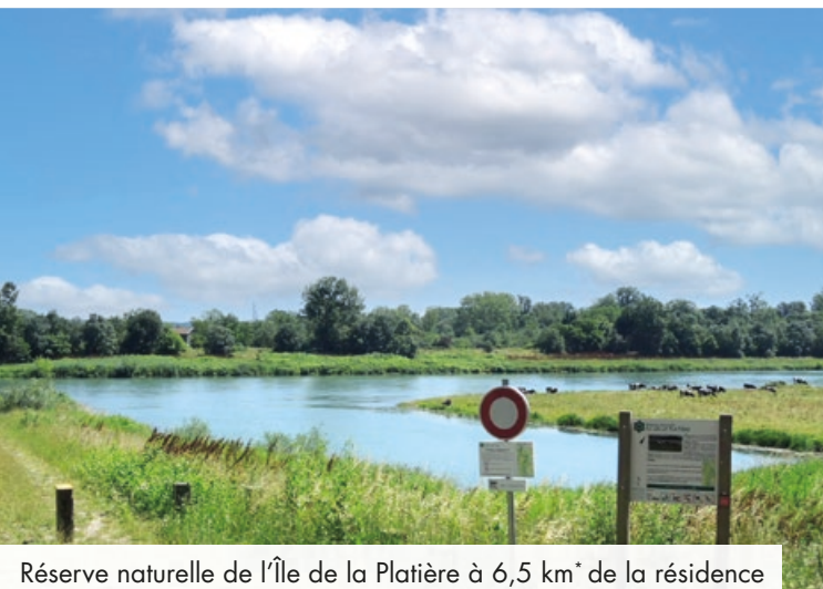
Réserve naturelle de l'Île de la Platière à 6,5 km* de la résidence