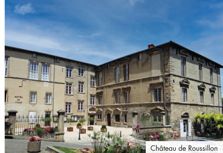
Château de Roussillon

À mi-chemin entre Lyon et Valence, le pays Viennois propose une réécriture douce et parfumée de votre quotidien. Mariant environnement naturel d'exception, trésors patrimoniaux et activité économique, un équilibre de vie vous tend les bras. Cap vers le sud de Vienne où l'ancien bourg fortifié de Roussillon vous ouvre ses portes.