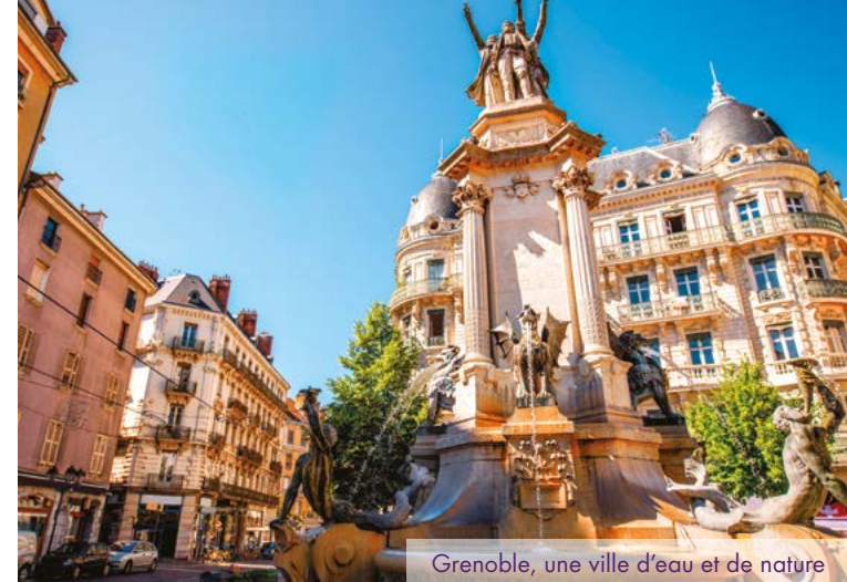
Grenoble, une ville d'eau et de nature

Au cœur d'un écrin naturel hors du commun, Grenoble s'engage à créer un cadre de vie haut en couleurs conjuguant loisirs, développement économique et respect de l'environnement. Intimement liée aux massifs alpins, dans lesquels elle puise toute son inspiration, la capitale du Dauphiné affiche clairement son ambition : s'imposer en cheffe de file des villes nouvelle génération.