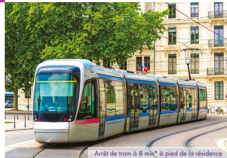
Arrêt de tram à 8 min* à pied de la résidence