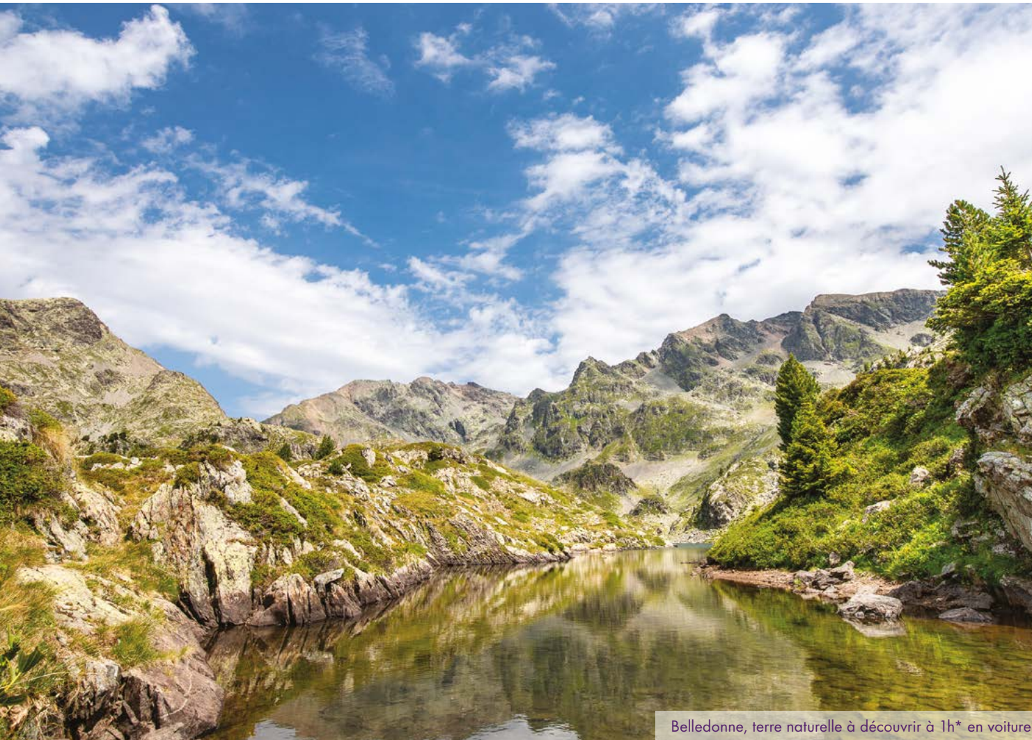
Belledonne, terre naturelle à découvrir à 1h* en voiture