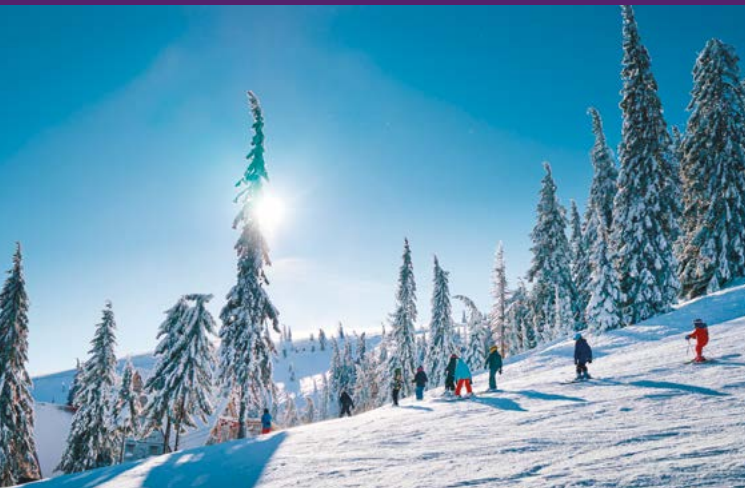
Station de ski Chamrousse à 45 min* de la résidence

Téléphérique (de Grenoble au sommet de la Bastille) à 19 min* en bus