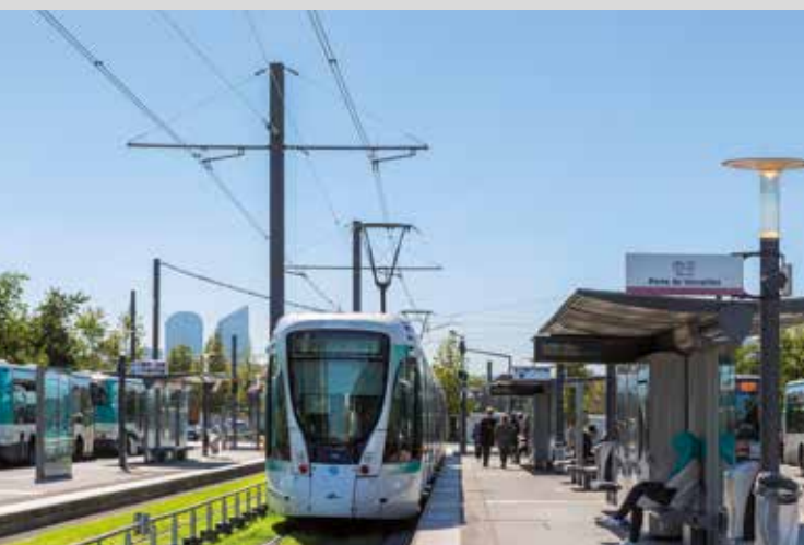
Le tramway T2 Pont de Bezons à 15 min* de la résidence