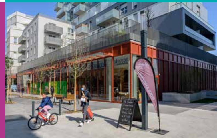
Le centre-ville piéton et commerçant à 6 minutes à pied de la résidence