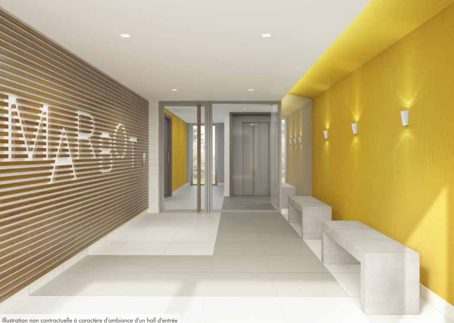
Illustration non contractuelle à caractère d'ambiance d'un hall d'entrée