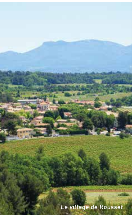
Le village de Rousset

Paisible et accueillant, le village de Rousset vous fera vivre la Provence sous son meilleur jour, dans un cadre particulièrement enchanteur. Au quotidien, vous apprécierez aussi la vitalité de son centre-ville et de ses commerces, accessibles en 5 minutes* à pied, ainsi que la richesse de son offre scolaire, culturelle, sportive et associative. Sa desserte en transports vous permettra notamment de rejoindre facilement Aix-en-Provence, Marseille et Nice.