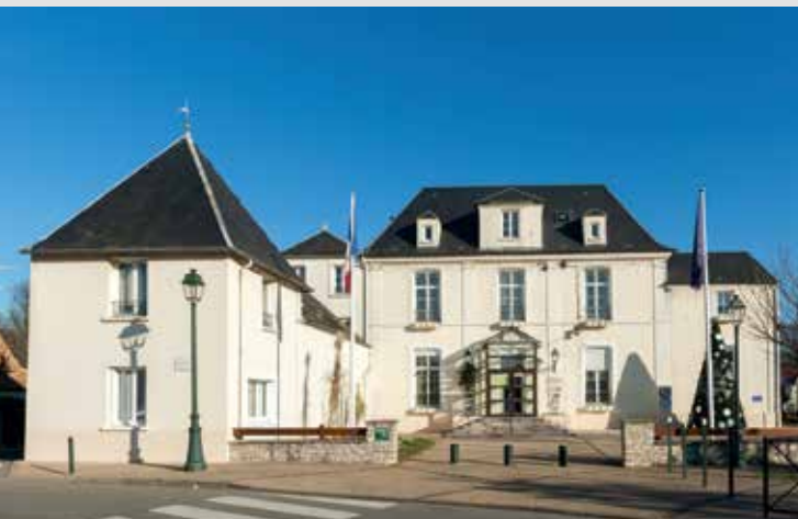
Hôtel de ville de Magnanville