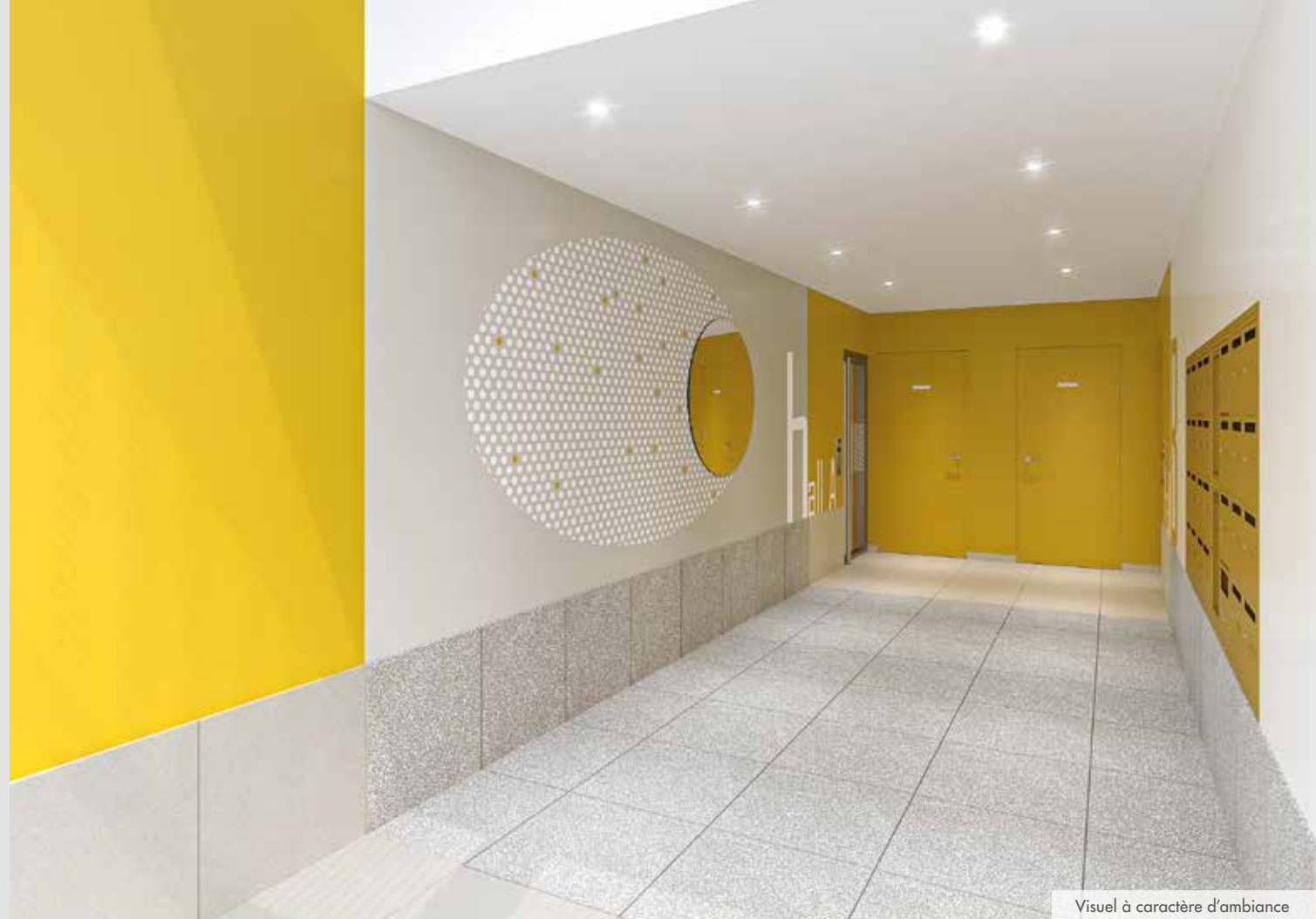
Visuel à caractère d'ambiance