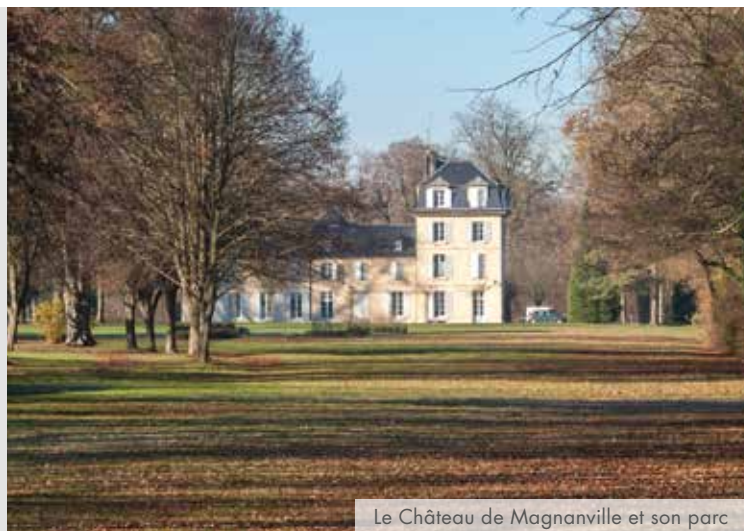
Le Château de Magnanville et son parc