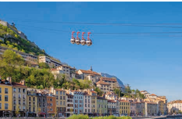
Grenoble, ses quais et son téléphérique à 18 min* de la résidence