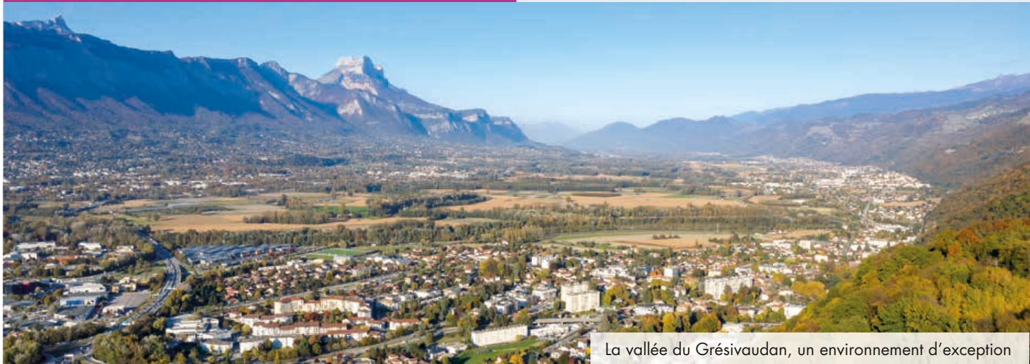
La vallée du Grésivaudan, un environnement d'exception