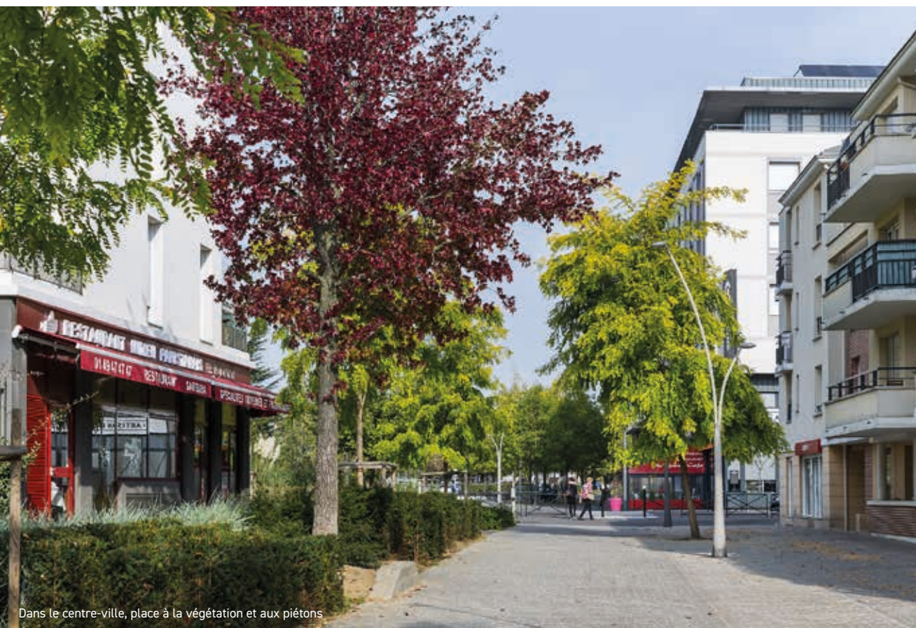
Dans le centre-ville, place à la végétation et aux piétons

À quelques minutes de la Porte de la Villette, Le Blanc Mesnil est au cœur de grands pôles économiques très attractifs tels que Roissy-Charles de Gaulle, le Bourget ou encore le Stade de France. Bientôt desservie par la ligne 16 du Grand Paris Express, la ville n'en finit pas d'attirer investisseurs et nouveaux arrivants, séduits par son excellente situation et par sa qualité de vie pleine de dynamisme, de charme et de verdure. Véritable