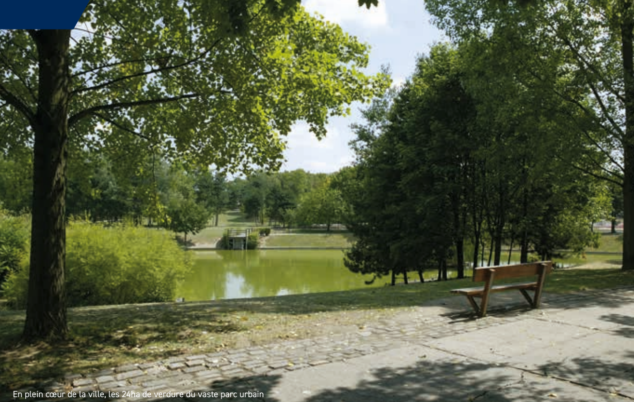
En plein cœur de la ville, les 24ha de verdure du vaste parc urbain