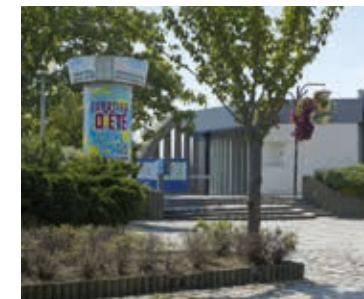
Le parvis de la gare RER B agréablement paysager. Le RER B relie Paris en 16 min seulement.

Des transports qui desservent Paris et les pôles économiques majeurs