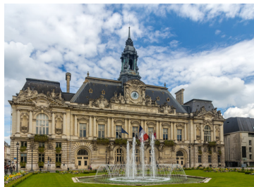
Place de l'Hôtel de Ville, Tours