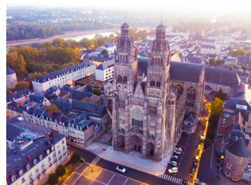
Cathédrale Saint-Gatien, Tours