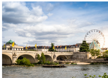
Pont Wilson, Tours