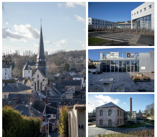
Vue du centre du village depuis le plateau, le lycée Condorcet, le cinéma et centre culturel Le Domino et le musée de la Nacre et de la Tabletterie

Ce service «à la demande» permet de vous transporter par minibus à l'intérieur de Méru, mais aussi entre les différentes communes de la communauté.