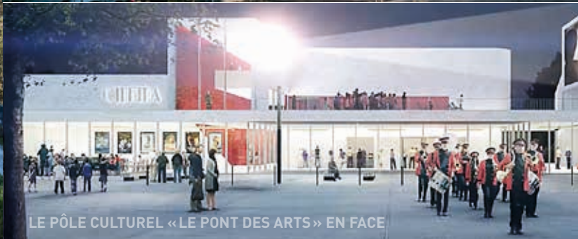
LE PÔLE CULTUREL « LE PONT DES ARTS » EN FACE