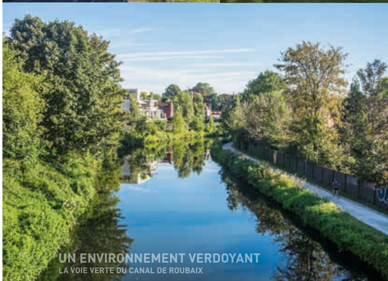
UN ENVIRONNEMENT VERDOYANT LA VOIE VERTE DU CANAL DE ROUBAIX