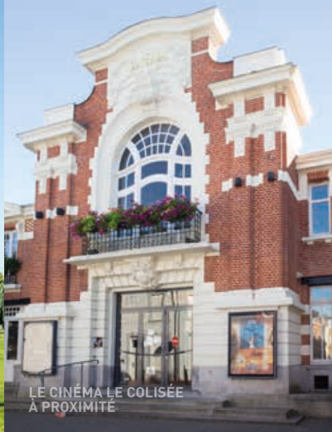
LE CINÉMA LE COLISÉE À PROXIMITÉ