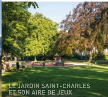
LE JARDIN SAINT-CHARLES ET SON AIRE DE JEUX