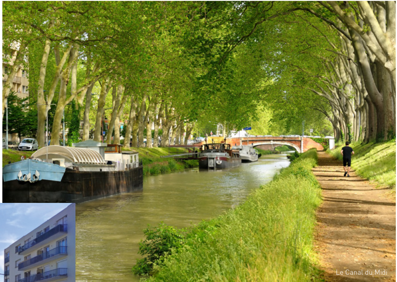
Le Canal du Midi

Situé au nord de Toulouse, le quartier des Minimes a su préserver une identité forte et emblématique de la vie toulousaine. Ce lieu se distingue par une atmosphère agréable où cohabitent des maisons au cachet traditionnel et des infrastructures modernes. Au détour des ruelles, il n'est pas rare de croiser de jolies maisons indépendantes datant du XIXème siècle et constituées de briques roses et de galets, que l'on nomme communément « Toulousaines ». L'avenue des Minimes est, quant à elle, le point de rencontre des habitants qui profitent de nombreux commerces et services.