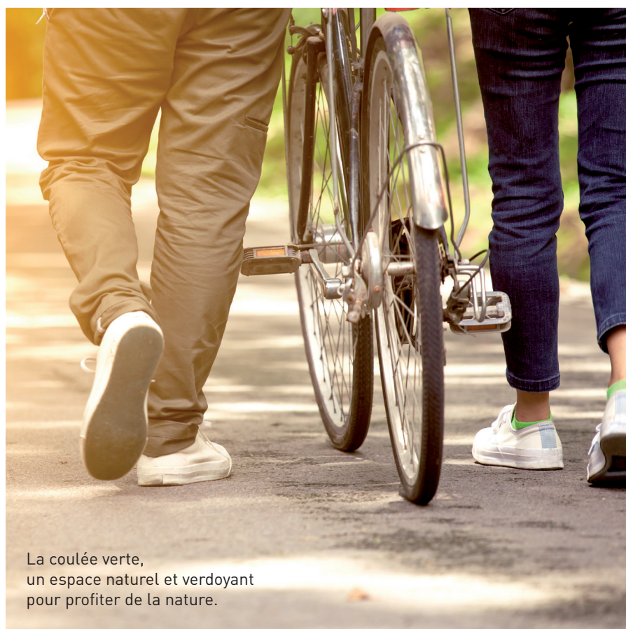
La coulée verte, un espace naturel et verdoyant pour profiter de la nature.

Idéalement situé à une vingtaine de minutes de Rouen et à peine plus d'une heure de Paris, Le Petit-Quevilly profite pleinement du dynamisme et des services de la métropole dont il est acteur. Son accès direct à l'A13 permet à la ville de rayonner quotidiennement vers les principaux centres économiques de la région. Si la situation géographique du Petit-Quevilly est un vrai atout, son cadre de vie, historiquement industriel, sera celui de son avenir et de son renouveau. Facilité d'accès aux transports en commun et volonté de la municipalité de renforcer une qualité de vie de village font partie des nombreux atouts du programme. Ecoles, commerces et services sont à proximité immédiate et le programme Nouvel Angle profitera de toutes les commodités utiles pour vous assurer une vie facilitée au quotidien.