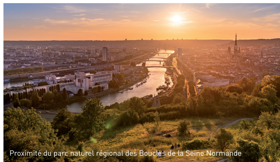
Proximité du parc naturel régional des Boucles de la Seine Normande