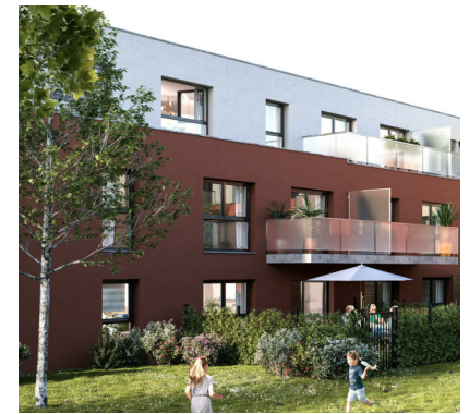
PLAN DE VENTE