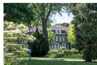
Mairie et un des jardins publics d'Haubourdin