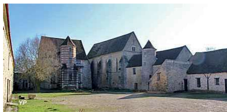
De gauche à droite : Le Grand Morin traversant la ville / Vue du centre ville, le théâtre au premier plan / Commanderie des peupliers