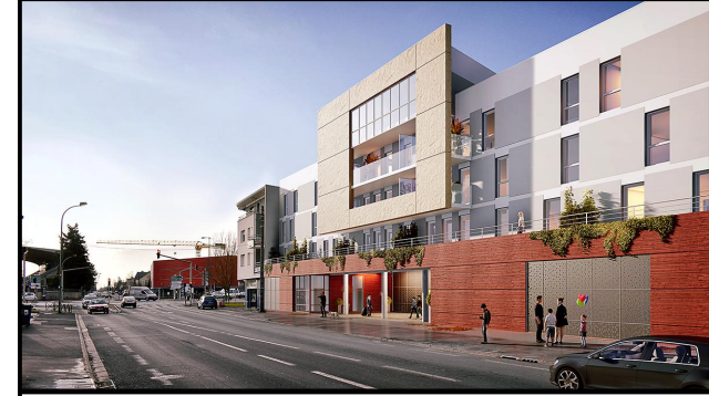
RESIDENCE ETUDIANTE EKO'CAMPUS Avenue Jacques Coeur 86000 POITIERS