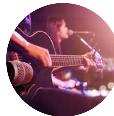
Théâtre Auditorium de Poitiers