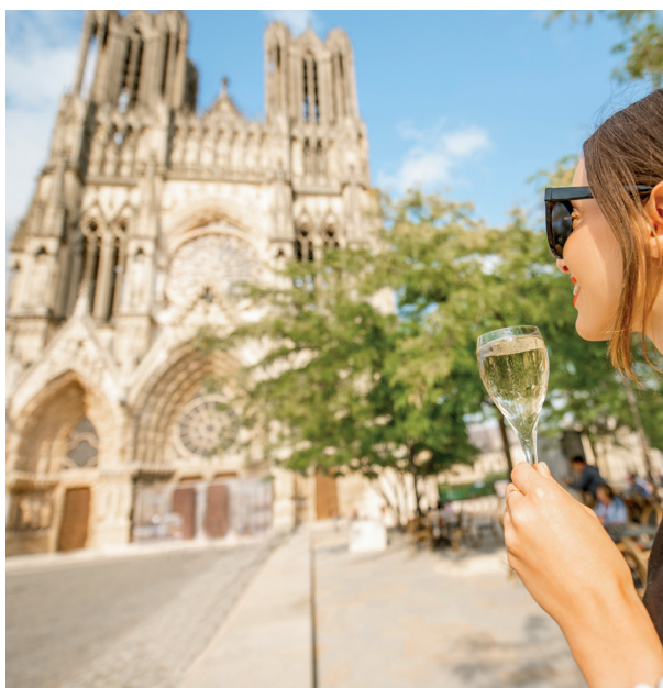
La cathédrale Notre-Dame de Reims