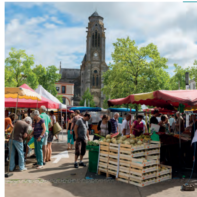
Marché dominical, place Charles de Gaulle

Un argument de plus pour motiver sa population jeune et moins jeune, valletaise ou plus large !