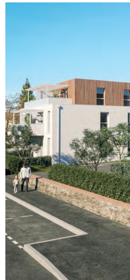
Illustration non contractuelle