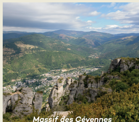
Massif des Cévennes