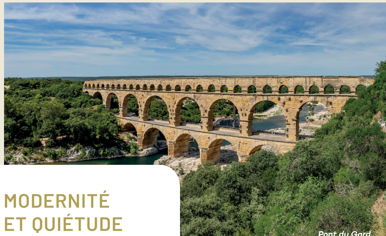
Pont du Gard