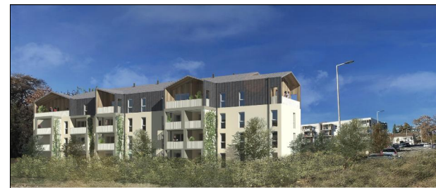
RESIDENCE MONTE BUCIÈRO BOULEVARD DE BRUXELLES 64140 LONS