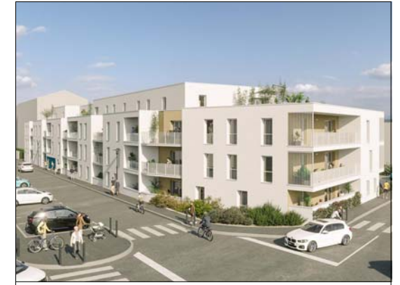
MAITRISE D'OUVRAGE SAS EDMP - Pays de Loire