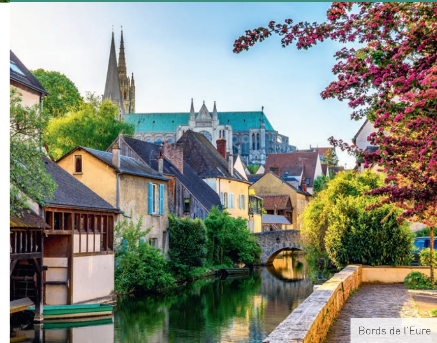
Bords de l'Eure