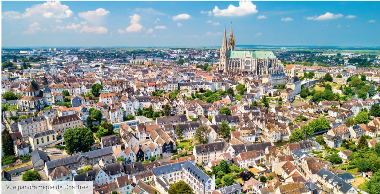
Vue panoramique de Chartres