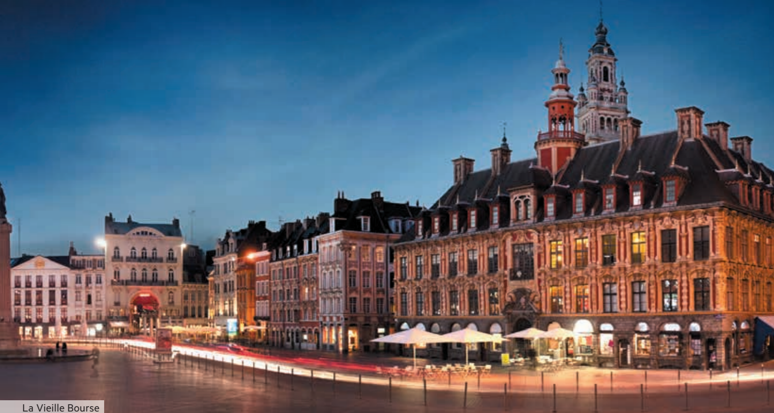
La Vieille Bourse