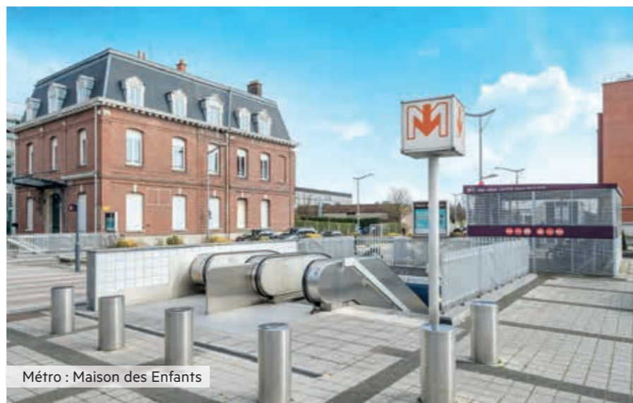
Métro : Maison des Enfants

Lomme fait partie de ses villes de la métropole directement reliées au centre-ville de Lille par le métro. Toute une branche du réseau lui est dédiée avec pas moins de 7 stations, c'est dire si Lomme se sent lilloise jusque dans son artère principale, l'avenue de Dunkerque, véritable prolongement du Boulevard Montebello de Lille.