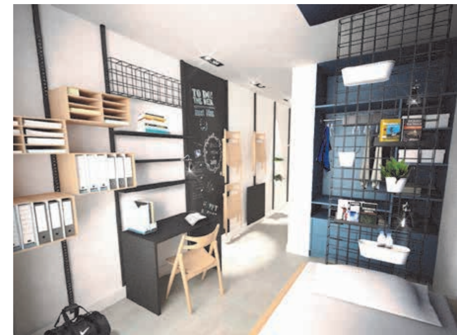
RÉSIDENCE ÉTUDIANTE JOÏA