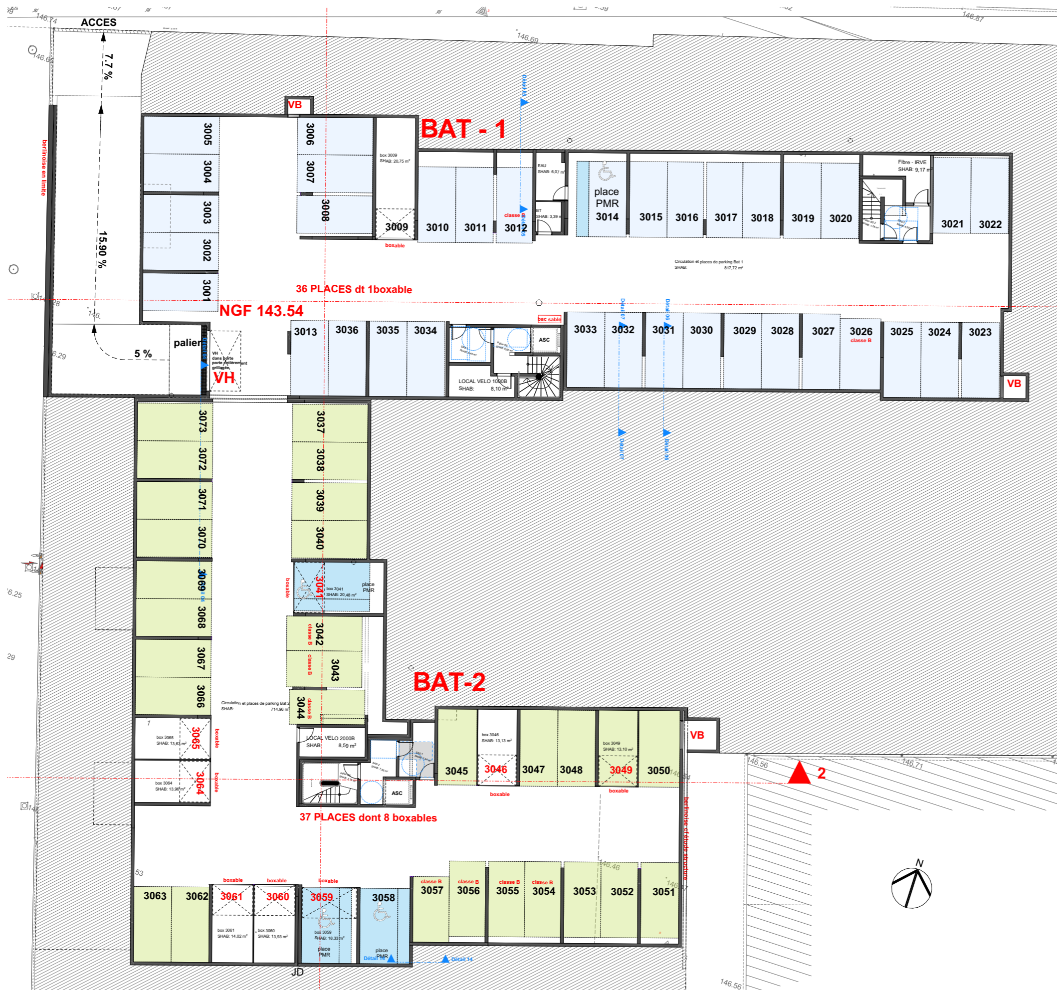
PLAN DE NIVEAU