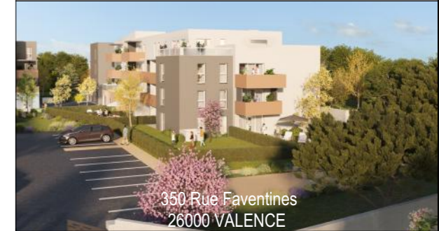
PDV - PARKING EXTERIEUR