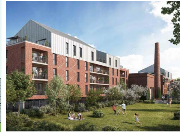
image illustrative non contractuelle