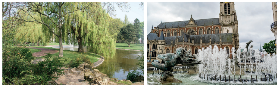
Le parc Georges Clemenceau à 8 min à pied, le centre-ville de caractère avec l'église Saint-Christophe, merveille de style néogothique