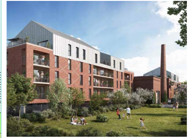
Image illustrative non contractuelle