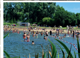
De haut en bas : l'église et le parc du château de Nieppe, la plage aménagée de la base de loisirs des Prés du Hem.