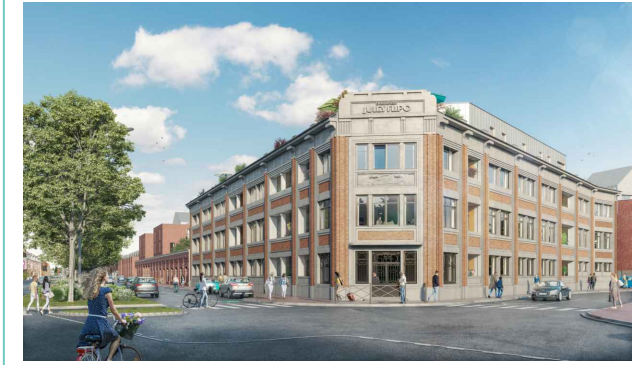
image illustrative non contractuelle