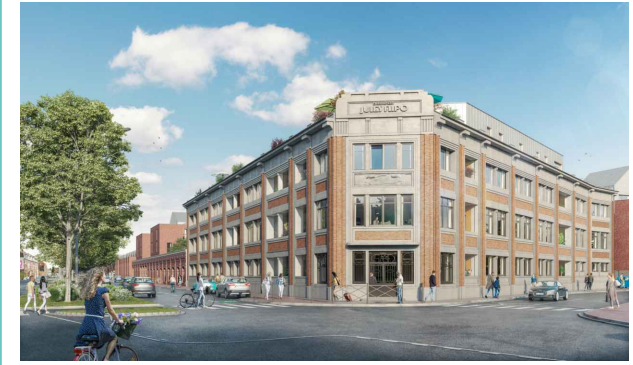
image illustrative non contractuelle