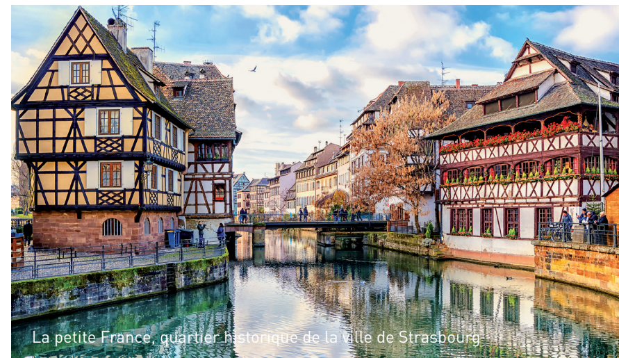
La petite France, quartier historique de la ville de Strasbourg