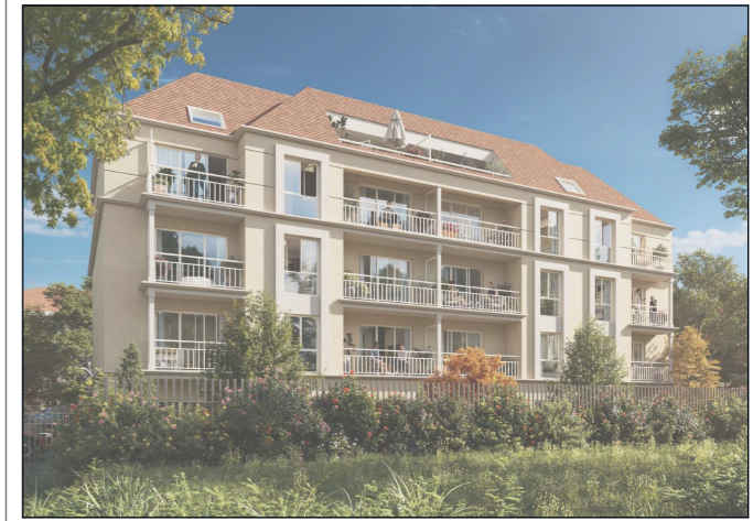
6-8 rue Albert Jacquard LIMEIL-BREVANNES