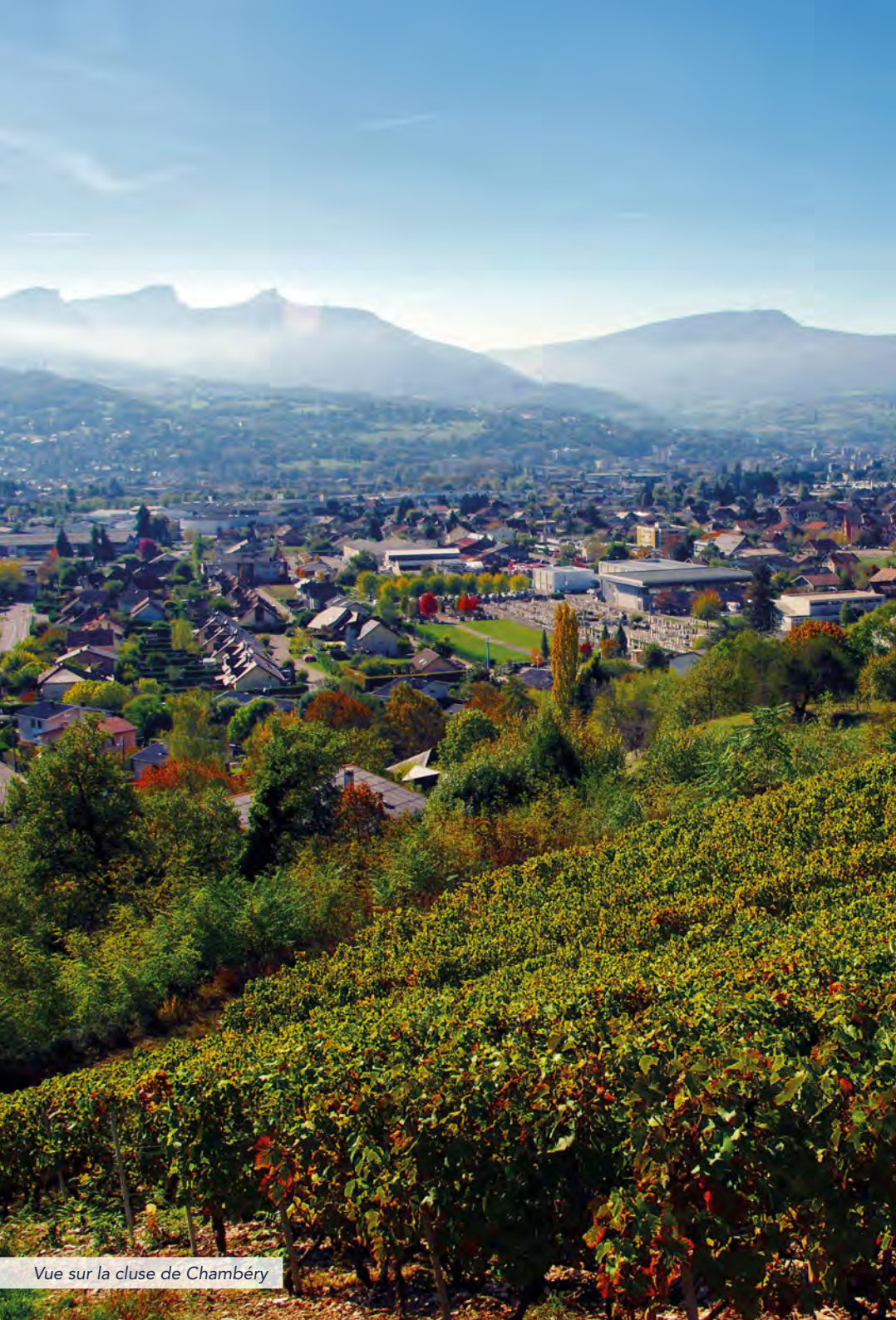
Vue sur la cluse de Chambéry