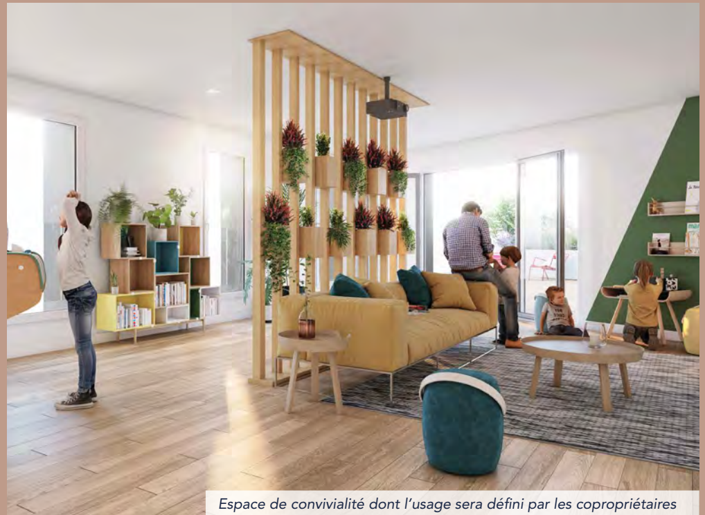
Espace de convivialité dont l'usage sera défini par les copropriétaires