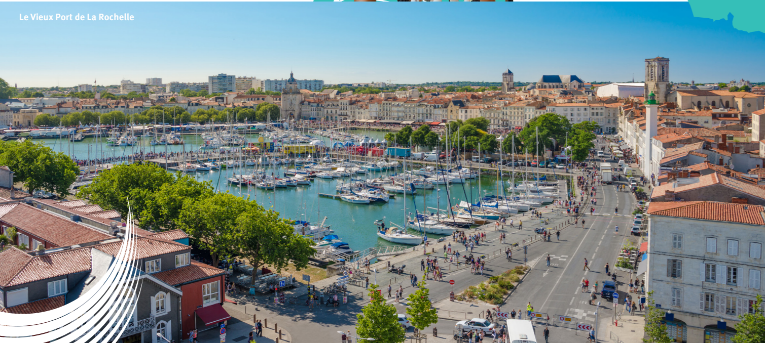
Le Vieux Port de La Rochelle

Bordée par l'océan Atlantique avec sa large baie et sa plage de plus de 2 kilomètres, Aytré est aujourd'hui la deuxième ville de l'agglomération Rochelaise. La raison ? Son véritable statut de carrefour routier qui en fait un passage obligé pour se déplacer au sein du département. Ainsi, sont facilement accessibles la N137 qui relie Saint-Malo à Bordeaux en passant par La Rochelle et la D939 qui relie La Rochelle à Angoulême via Saint-Jean-D'Angély notamment. Aytré-Plage est même desservie par deux TER.