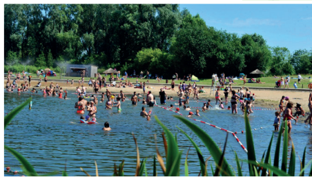
Les Prés du Hem