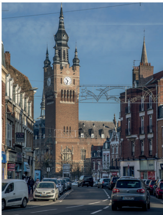
L'Hôtel de Ville et son beffroi au cœur du centre ville animé