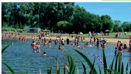
Les Près du Hem