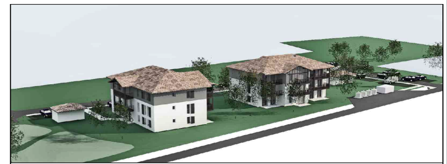
PLAN DE COMMERCIALISATION

VILLA ENEKO RUE DU PERTIC 64120 SAINT PALAIS