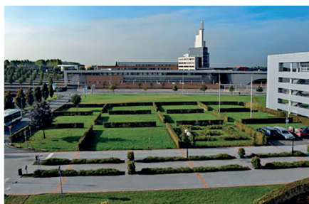
EURASANTÉ à 16 min à pied.