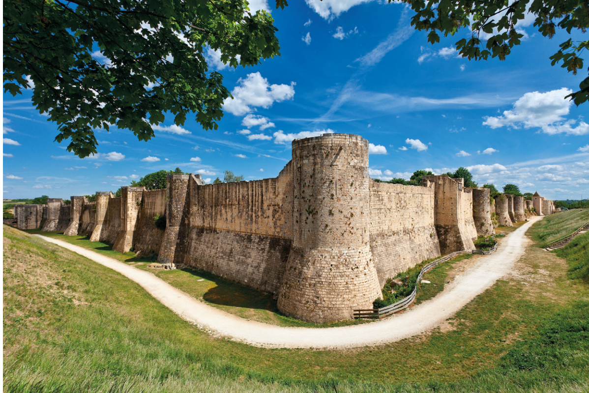
■ LES REMPARTS DE PROVINS , impressionnante fortification édifée au XIII e siècle sur 5 kilomètres.