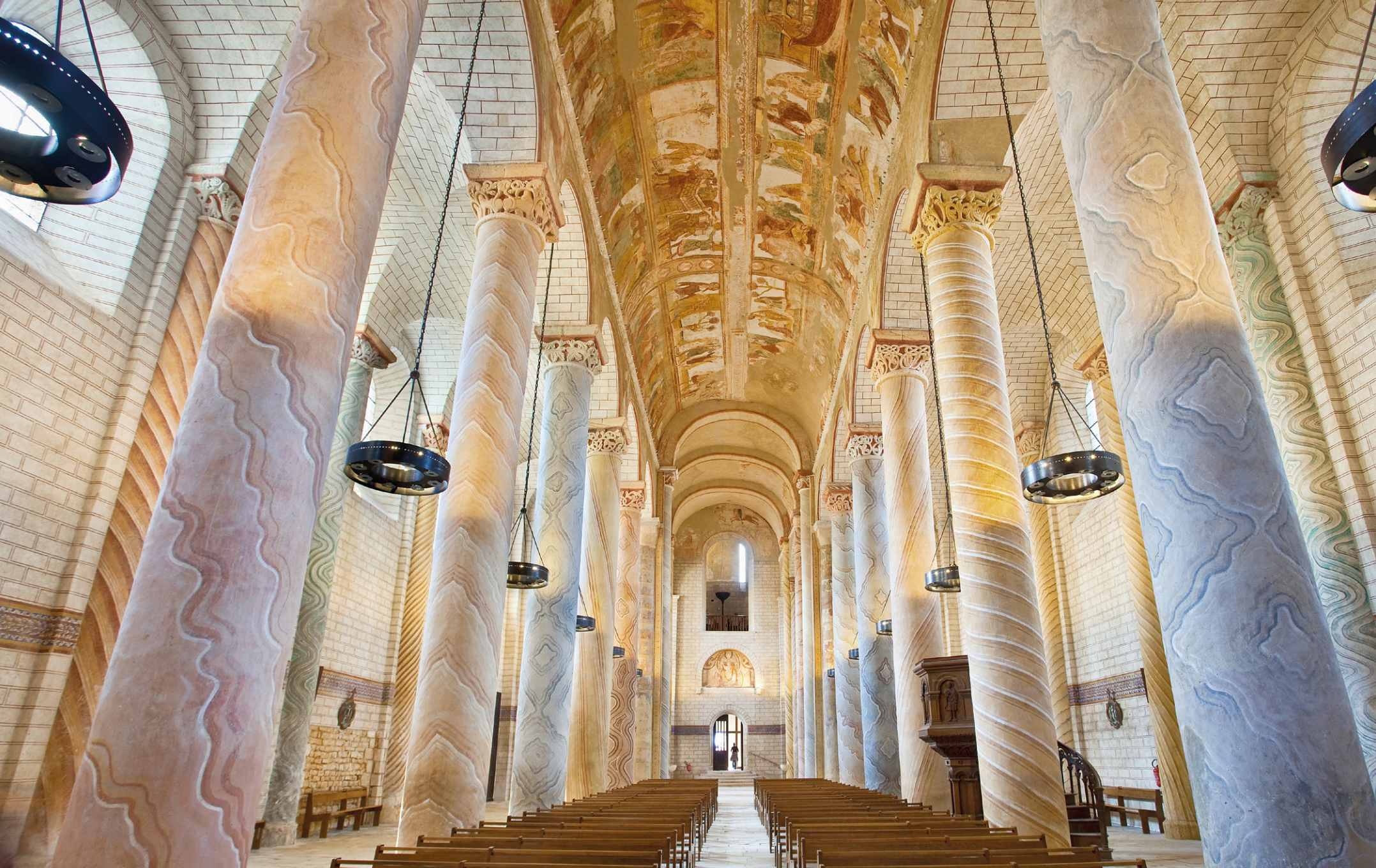
■ FLEURON DE L'ART ROMAN , l'abbaye de Saint-Savin-sur-Gartempe rayonne sur toute l'Aquitaine au milieu du IX e siècle. Elle doit son prestige à ses peintures murales et ses colonnes aux tons pastel qui font d'elle l'un des hauts lieux de l'architecture monastique.