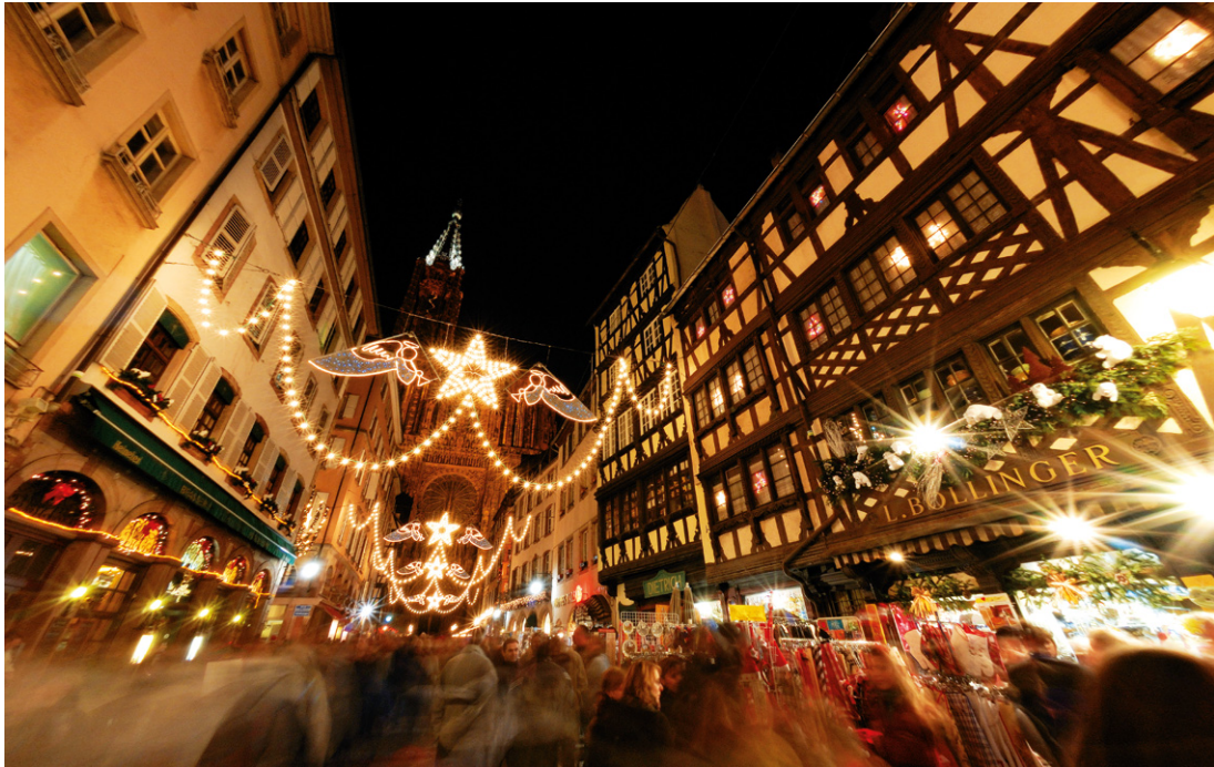
À Strasbourg, la rue Mercière se métamorphose en un torrent de lumière avec la cathédrale en point de fuite.