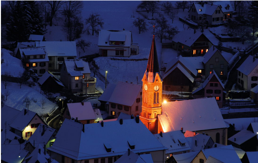
Le village de Soutzeren est comme blotti autour de son église illuminée dans la douceur de l'aveut.