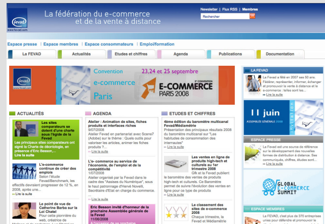
Figure 1-6 Le site de la Fevad (Fédération du e-commerce et de la vente à distance)

► http://fevad.com/ site de la Fevad (figure 1-6).