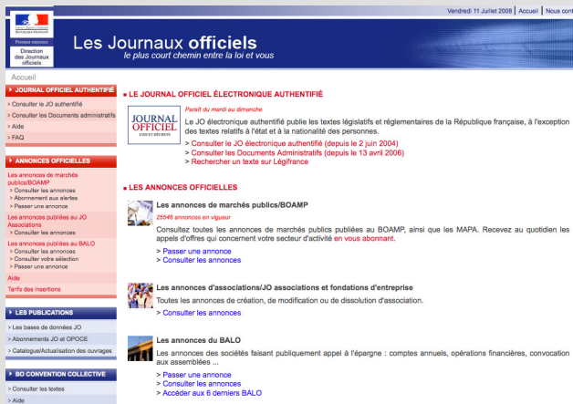
Figure 1-4 Le site du Journal Officiel

► http://www.journal-officiel.gouv.fr/ site du Journal Officiel (figure 1-4).