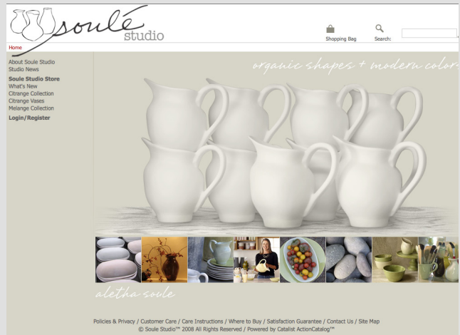
Figure 1-10 Le site Soulé Studio

► http://www.soulestudio.com/ site proposant des vases de toutes les formes exposés selon un graphisme simple et efficace. Grâce à la présentation du site, il est possible en permanence de visualiser les autres modèles ou couleurs disponibles (figure 1-10).