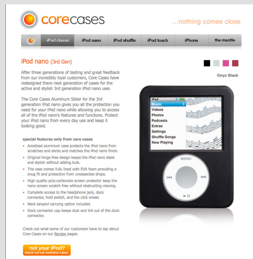
Figure 1-11 Le site Corecases

► http://www.corecases.com site de vente en ligne de protections pour les lecteurs MP3 d'Apple. Son graphisme est très soigné et la présentation des produits irréprochable (figure 1-11).