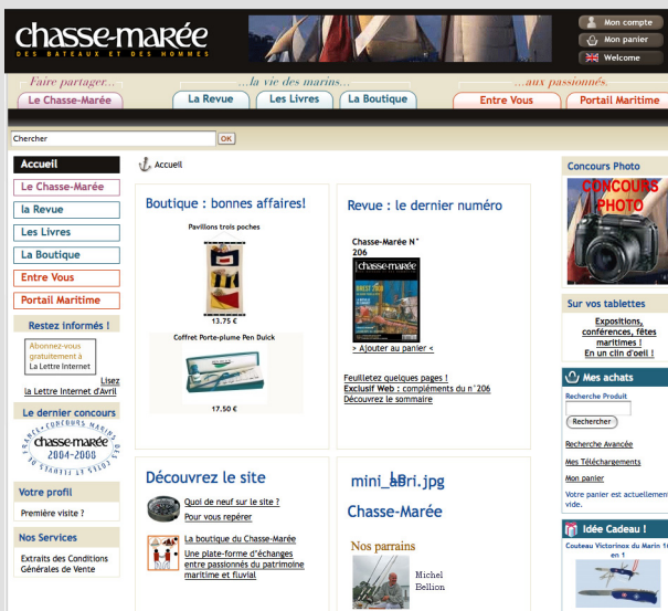
Figure 1-9 Le site Chasse-Marée

► http://www.chasse-maree.com/ site des éditions Glénat. Cette boutique, réalisée grâce à VirtueMart, propose plus de 1 500 objets ainsi qu'une plate-forme d'échange communautaire et un blog (figure 1-9).