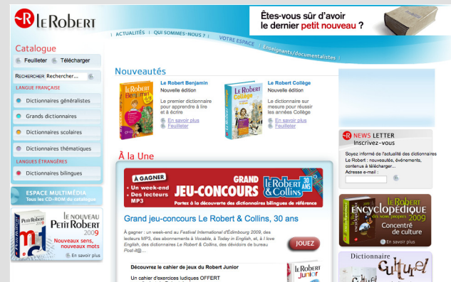
Figure 1-5 Le site des dictionnaires Le Robert

► http://fevad.com/ site de la Fevad (figure 1-6).