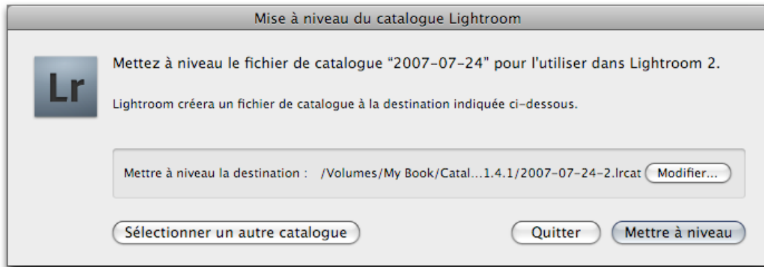
Dialogue de mise à jour d'un catalogue

Après installation de Lightroom 2.0, une mise à jour de l'ancien catalogue (Lightroom 1.0 à 1.4.1 et 2.0 bêta) va se mettre en place au démarrage de l'application. Elle est obligatoire ; si vous ne désirez pas l'effectuer, vous devrez créer un nouveau catalogue et réimporter vos images.