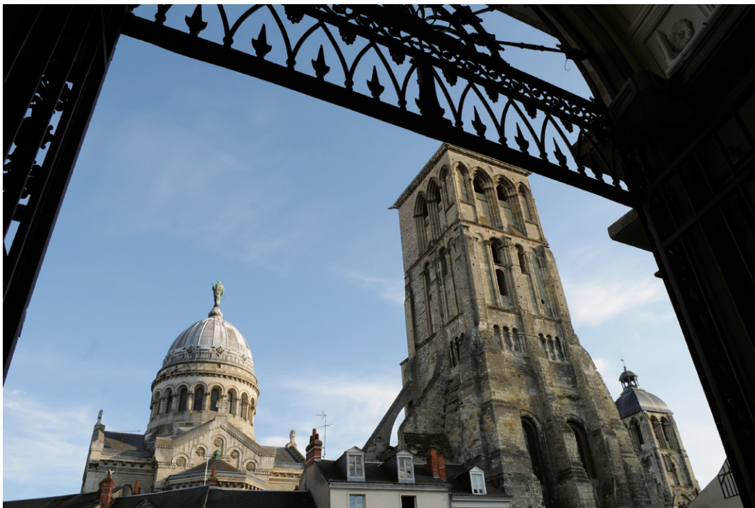
Les vestiges de l'ancienne basilique Saint-Martin, qui fut un phare de l'Occident chrétien, la tour Charlemagne et la tour de l'Horloge voisinent avec la nouvelle basilique construite par Victor Laloux de 1886 à 1902.