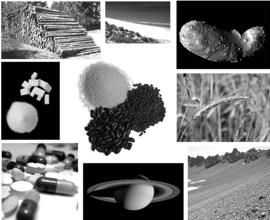
FIG. 1.2 – Les milieux granulaires forment une famille extrêmement vaste.

de transformation, auxquels les industriels ont répondu par des procédés astucieux mais souvent empiriques.